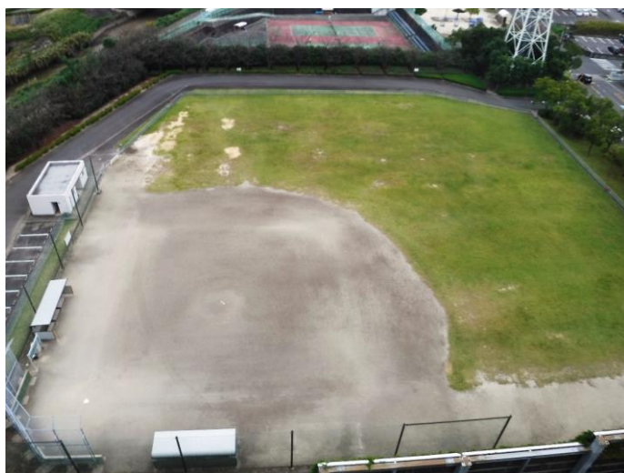
刈谷知立環境組合グラウンド

(問い合わせ先) 刈谷知立環境組合クリーンセンター 刈谷市半城土町東田46番地 電話 0566-21-5389